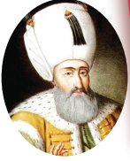
Kanuni Sultan Süleyman

“Halk içinde muteber bir nesne yok devlet gibi, Olmaya devlet, cihanda bir nefes sıhhat gibi” Anlamı: Halkın gözünde devlet (iktidar) gibi değerli bir şey yok. Halbuki şu dünyada bir nefes sıhhat gibi devlet (güç) olamaz.