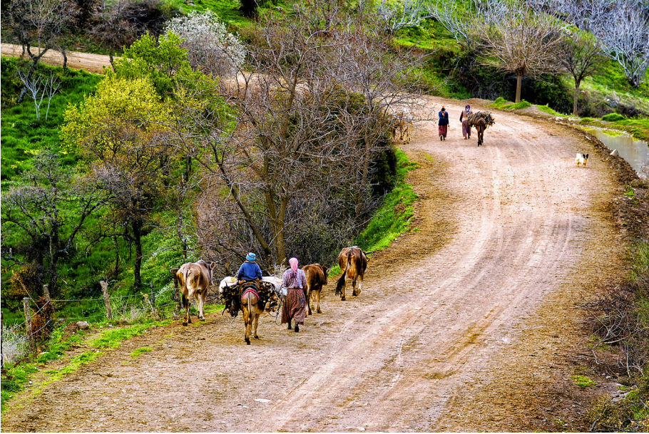
Kaynak: İşten eve dönüş , Mart, 2007, Nazilli / Aydın / Cihan KARACA

Aytuna'ya göre (1949) hayat bilgisi, okula gelmeden önce çocuğun evinde, ailesi içinde ve gezip dolaştığı çevrelerde kendi kendine ve başkaları yardımı ile edindiği bilgileri kontrol eden, tamamlayan ve çocuğa yeni ve gerçek bilgiler kazandıran bir derstir. Taner ve Örs'e göre (1952: 49) hayat bilgisi dersi; çocuğun çevresindeki doğal ve toplumsal anlayışı, onun anlayış derecesine göre, bir bütün olarak kavratmaya çalışan bir derstir. Baymur'a göre ise (1937: 2) hayat bilgisi, çocuğa içinde bulunduğu doğal ve toplumsal çevreyi, onun görüş ve kavrayışına uygun bir tarzda, "bütün hâlinde" kavratmaya çalışır. İnsanoğlunun iki yaşam alanı vardır. Bunlar doğal çevre ve toplumsal çevredir. İnsanoğlu doğal ortamlarda toplumsal etkinliklerini gerçekleştireceğinden bu iki çevreye aynı anda uyum sağlamak zorundadır. Nitekim doğal çevreye uyum sağlayamamış bir insanın toplumsal etkinliklerini yerine getirebilmesi mümkün görülmemektedir. Örneğin iklim koşullarına uygun giyim tarzını alışkanlık hâline getirmeyen birinin hastalanması kaçınılmaz olacaktır. Hastalanan bireyin toplumsal etkinliği azalacak ve bu da toplumsal çevrelerden uzaklaşmasına neden olacaktır. Bu nedenle de çocuğun içinde yaşadığı çevrelere uyumu için ona gerekli olan bilgi, beceri, değer, tutum ve alışkanlıkların kazandırılması gereği ortaya çıkmaktadır.