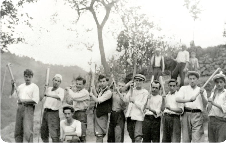
Foto 3. Görele köylerinde buğday başağı dövme imecesi (1950'li yıllar) - Giresun

Sürekli çalışma temposu, insan bünyesinin de bir noktaya kadar taşıyabileceği yüküdür. Üstelik fizyolojik ve psikolojik yan etkiler bırakabilir. İnsan yaşamdan bıkmaz. O halde, ağır ve yoğun çalışmalarını eğlenceli bir uğraş haline dönüştürmek gereklidir. Geçmişte, bir aile için uzun zaman alabilecek işler, köylerde akraba ve komşuların güç birliği içinde kısa sürede çözümlenirdi. Anadolu'da çok yaygın olan bu gelenek "İmece" adıyla bilinir. Denebilir ki, 20 - 30 yıl öncesine kadar bu gelenek, kurallarını koruyarak gelmiş, ancak günümüzde önemli ölçüde terk edilmiştir. O dönemlerde çay, fındık böyle toplanır, çayrılar böyle biçilir, fındıkların ya da mısırların kabuklarından çıkarılması, tarlaların kazılması - belenmesi, buğday başaklarının dövülmesi, zeytinlerden yağ çıkarılması böyle gerçekleşirdi.