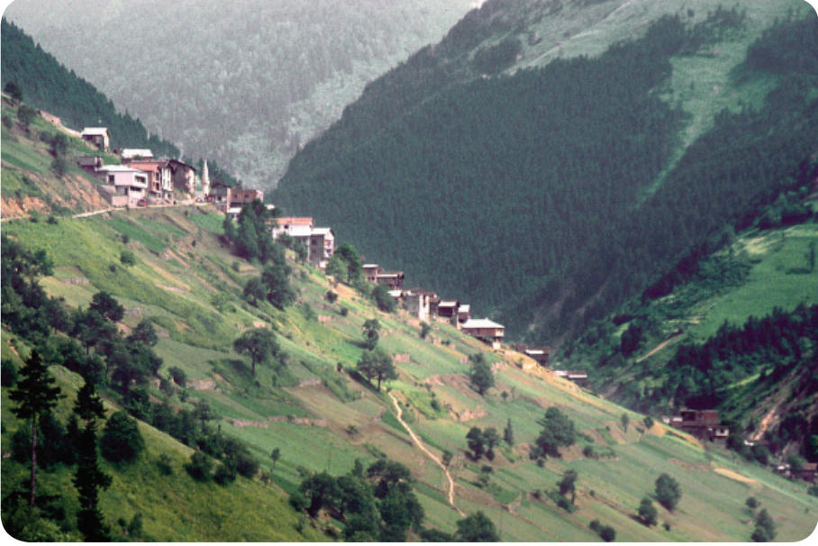
Foto 1. Karaçam, Çaykara - Trabzon

Çevrede her şey enerji dolu ve hareket halindedir. Bir gün içinde üç – dört mevsim koşulları yaşanabilir bu bölgede. Siz oturuyor olsanız bile rüzgâr etkisiyle otlar, ağaçlar, sisler hareketlidir. İşten işe koşuşturan insanlar, süt hayvanları, tavuklar, kediler, köpekler gözlerinizde sürekli hareket izlerini bırakırlar.