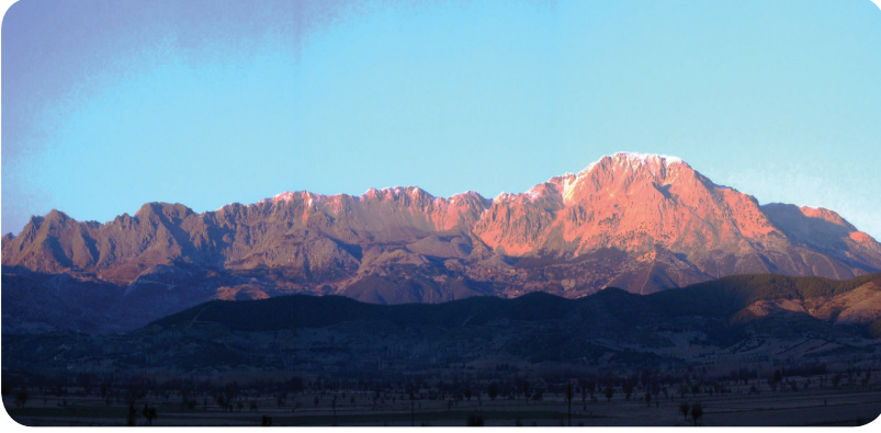
Fotoğraf 5. Ağlasun kasabası kuzeyinde doğu-batı doğrultusunda uzanan Akdağ (Baca Tepe: 2271 m.)’dan bir görünüm.

Batı Torosların iç sıraları üzerinde bulunan ilçe toprakları, kuzeyde Akdağ (Baca Tepe: 2271 m.) ile en yüksek noktaya ulaşır. Güneye doğru gidildikçe yükselti değerlerinin azaldığı ve daha çok tepelik alanlardan oluşan bir yüzey şekli özelliği gösterir (Şekil 2). Dağlık ve tepelik alanların arasında ise karstik ovalar yer alır. İlçe toprakları dâhilinde yer alan karstik ovaların en önemlisi Mamak (Çanaklı) polyesidir (Fotoğraf 6). Bir “göl ova” özelliği gösteren polye ovası, kış mevsiminde çevreden gelen kar ve yağmur sularının düdenleri tıkaması sonucu göle dönüşür. Düdenlerin açık olduğu yıllarda polyede toplanan yağmur ve kar suları düdenlerle tahliye edildiği için polye ovaya dönüşür. Ağlasun kasabası ile Kibrit, Mamak (Çanaklı) ve Hisar köyleri tarım arazilerinin bir bölümü polye tabanında yer alır. Düdenlerin tıkanıdığı bazı yıllar tarım alanları zarar görür. Özellikle düdenlere yakın ve polyenin en alçak kesiminde yer alan araziler, ekip-biçme faaliyetleri yerine hayvanların kışlık ot ihtiyacını karşılamak amacıyla çayır arazisi olarak kullanılmakta ve yaz mevsimi sonunda çayırlar biçilerek hayvanların kışlık yem ihtiyacının bir bölümü karşılanmaktadır.