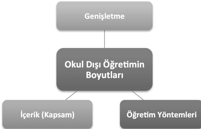
Şekil 2: Okul dışı öğretimin üç boyutu

Okul dışı öğretim üç boyutu bulunmaktadır. Bunlar aşağıdaki şekilde açıklanmıştır (Bunting, 2006; akt. Karademir, 2013).