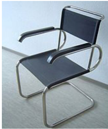
Görsel 5: Marcel Breuer: Destekli (kolçaklı) sandalye

12 Nisan 1933 yılında Nazi’ler tarafından kapatılmadan önce Bauhaus hocaları ve sanatçıları “modernizm” kavramının belirginleşmesini ve Batı tasarım eğitim yönteminin şekillenmesini sağlamışlardır. 19 Temmuz 1933’te son özgür hareket olarak Bauhaus üyeleri okulun tasfiyesine karar verdiler (Erzen, 2009). Dini ve politik düşünceleri yüzünden birçok sanatçının ülkeden kaçıp Amerika’ya yerleşmesiyle Bauhaus sanat ve tasarım eğitimi modelinin Amerikan sanat ve tasarım eğitimine etkisi çok büyük olmuştur.