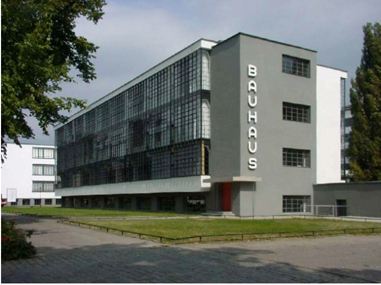
Görsel 4: Bauhaus Dessau

Weimar'da ancak altı yıl varlık gösterebilen Bauhaus, Nazilerin baskıları sonucu 1925 yılında Dessau'ya taşınarak burada yeniden eğitime ve öğretime başlamıştır. Dessau dönemi (1925-1932) Bauhaus'un kimliği ve felsefesinin tam olgunluğa ulaştığı dönem olmuştur. Bauhaus Okulu'nun endüstriye hizmetini ve savunduğu "Sanat toplum içindir" düşüncesini benimsemeyen diğer sanat okulları ve akademiler, Bauhaus yönetimini ve hocalarını yerel yönetim olan Nazi Partisine şikâyet etmişler ve zamanın sanat akademileri de, Gropius'u anarşist bulmuşlardır. Nas-yonal sosyalist tehditlerin günden güne artmasıyla birlikte Bauhaus, yedi yıl sonra 1932 yılında Berlin'e taşınarak, burada eğitim ve öğretimi sürdürmeye çaba göstermişse de Naziler tarafından 1933 yılında bir daha açılmamak üzere kapatılmıştır (Bulat ve Aydın, 2014).