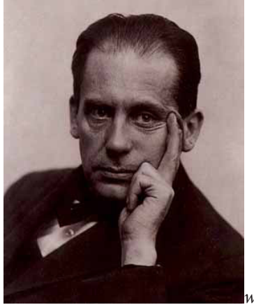
Görsel 3: Walter Gropius (1883–1969)

İkinci Dünya Savaşı öncesinde tüm dünyayı derinden etkileyen büyük ekonomik ve sosyal bunalım sırasında sanat ve tasarım eğitiminde önemli değişim ve gelişmeler olmuştur. Arthur Wesley Dow'un geliştirdiği ve uyguladığı biçimci (formalist) sanat ve tasarım eğitimi müfredatı daha kurumsal olarak Bauhaus Güzel Sanatlar Okulunda kendini göstermiştir. Bauhaus Almandada İnşa / Yapı Evi demektir. Mimar Walter Gropius'un 12 Nisan 1919 tarihinde Almanya'nın Weimer kentinde kurduğu Bauhaus Okulu , İngiltere'de yaygın olarak eğitim veren "Uygulamalı Sanatlar Okulları" (Schools of Applied Arts) sistemi ile Batı Avrupa'da tarihi bir geçmişe ve öneme sahip olan "sanatçı atölyesinde eğitim" sistemini kendi bünyesinde birleştirerek özgün bir sanat eğitimi felsefesi oluşturmuştur. Böylece II. Dünya Savaşından sonra Bauhaus'un kurucusu mimar Walter Gropius tarafından sanat ve tasarım eğitimi müfredatında yeni bir dil ve estetik model geliştirilmiştir. Bauhaus, Vkhutemas Okulunun savaş sonrası biçimci estetik görüşünü paylaşmış ancak politik görüş olarak kapitalist ekonomi ile sosyalist doktrin arasında bir denge kurmaya çabalamıştır (Daley and Bryant, 2015).