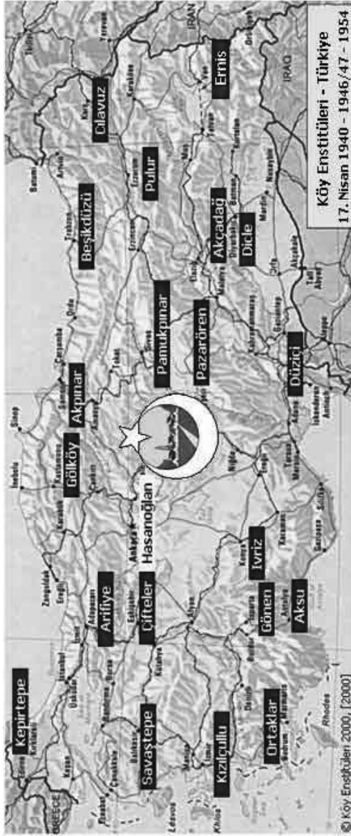
Köy Enstitüleri Haritası