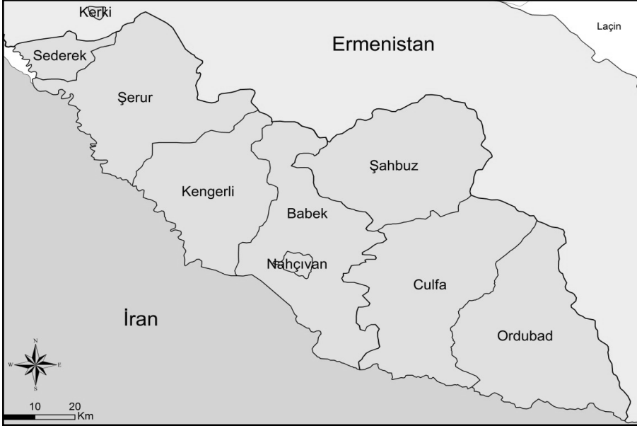
Harita 3: Nahçıvan Özerk Cumhuriyeti idari bölünüşüne göre rayonlar.

Ülke, tıpkı bağlı olduğu Azerbaycan Cumhuriyeti gibi, rayon 12 adı verilen idari yönetim birimlerine ayrılmıştır. Günümüz itibari ile ülke, başkenti Nahçıvan idari bölgesi dışında 7 rayondan oluşur (Sederek, Şerur, Kengerli, Babek, Şahbuz, Culfa ve Ordubad). Rayonların her birinin rayon merkezi statüsünde yönetim merkezleri vardır. Rayon merkezi durumundaki yerleşmeler kasaba ya da şehirdirler.