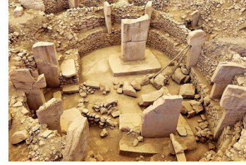
Arkeoloji (Kazı Bilimi)