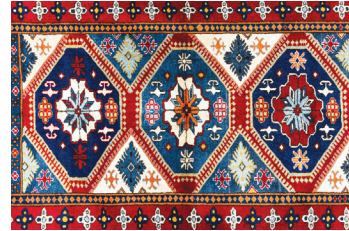
Etnografya (Kültür Bilimi)