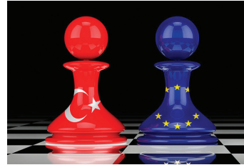
Diplomasi (Siyaset Bilimi)