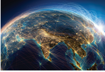
Coğrafya (Yer Bilimi)