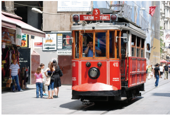
Sosyoloji (Toplum Bilimi)