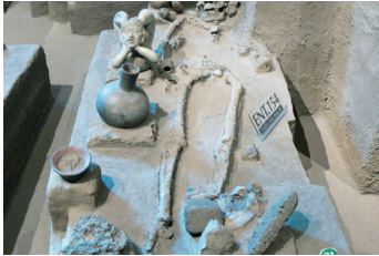
Antropoloji (Irklar Bilimi)