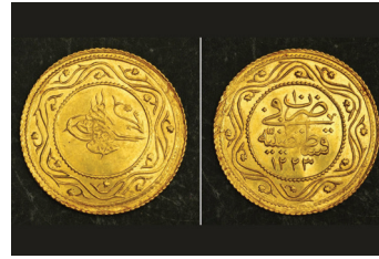
Nüzmatic (Meskukat Para Bilimi)