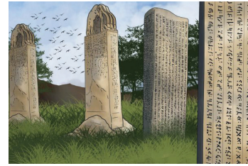
Epigrafya (Kitabeler Bilimi)