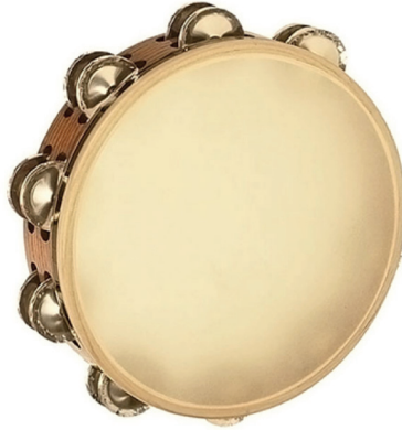
Görsel 1. Def Çalgısı

diyerek çantasına doğru yürüdü. Çantasından vurmali çalgılardan def çığartan İlham öğretmen, sözlerini şarkısı ile söyledi.