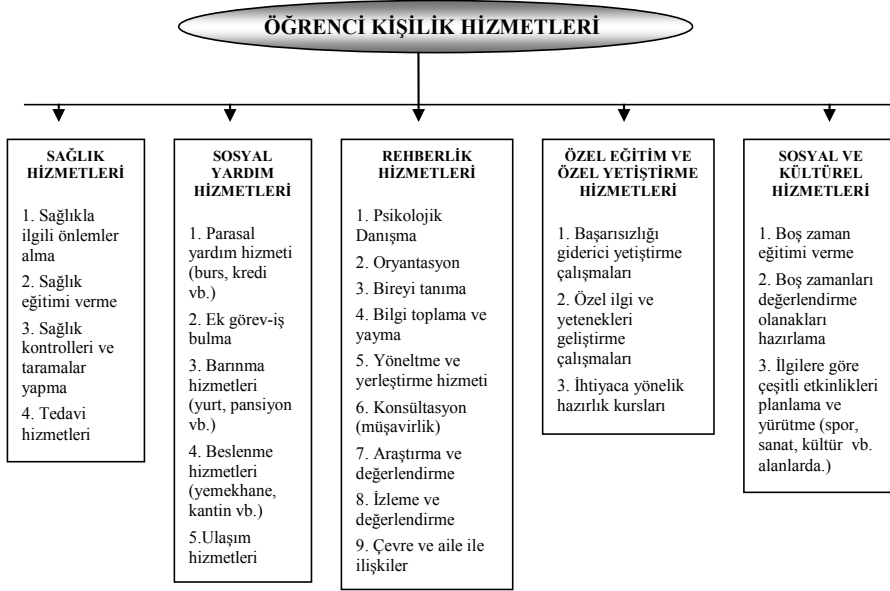
Şekil 1.2: Çağdaş Örgün Eğitim Kurumlarında Yer Alan Öğrenci Kişilik Hizmetlerinin Kapsamı

leri amaçlanan, kendi öz benliklerini ve kişiliklerini oluşturma ve geliştirmeleri beklenen, ilgi ve yeteneklerinin farkında olan ve bunları kullanıp geliştirebilen, yaşam sürecinde karşılaştığı sorunlarını çözebilen, akılcı düşünceler üretip analiz ve sentezler yapabilen bireyler olmalıdır. Çağdaş eğitim sistemine göre, her öğrenci saygıya değer birer varlıktır. Bu sistem içerisinde, bütün öğrenciler, çevresine, ulusal ve evrensel değerlere karşı saygı, sevgi ve hoşgörüyü sahip bireyler olarak gelişimlerini sağlamalıdır.